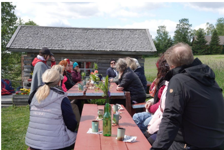
Kuva 2. Ennakointirykin pikaennakointi toteutettiin ulkoilmassa.