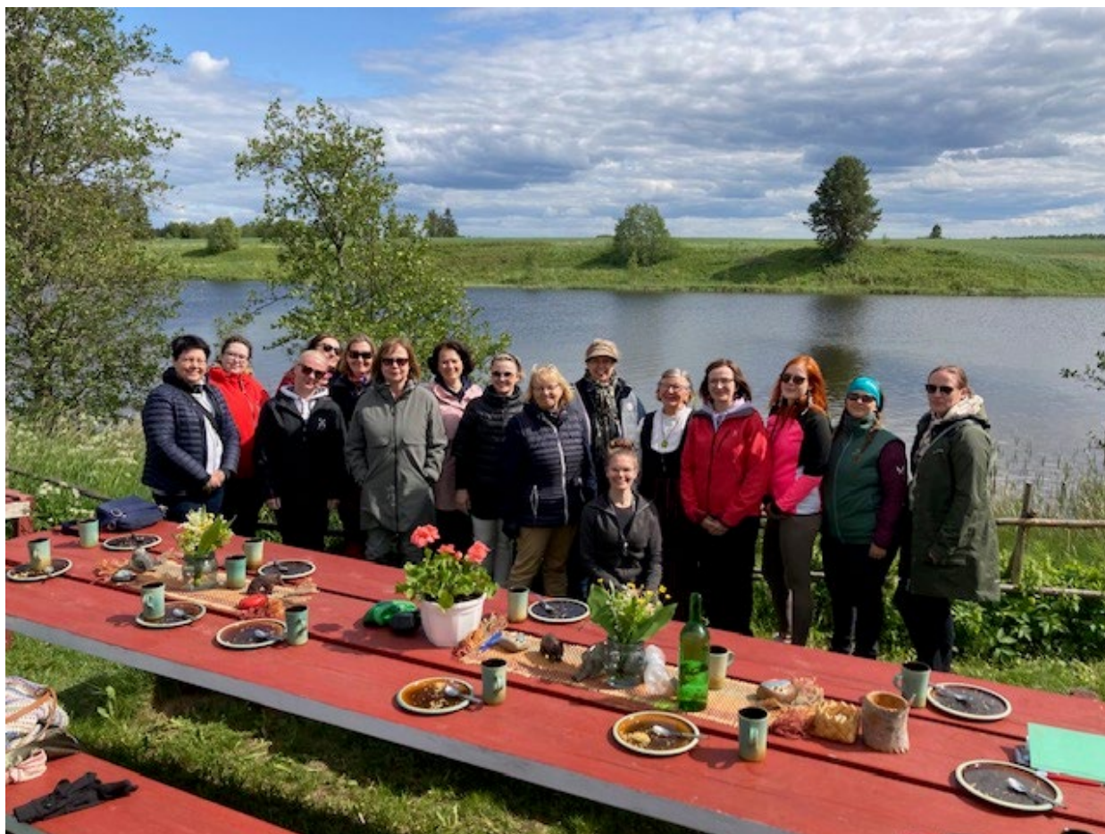
Kuva 3. Ennakointirykin edustajia pikaennakoinnin jälkeen.